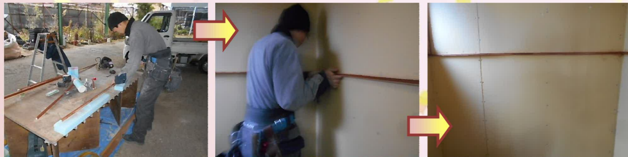
「 plaster-board」が貼られた壁に見切り桟を取り付けます。