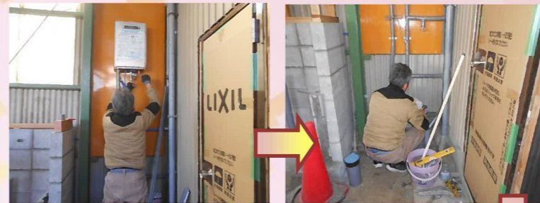
給湯器を取り付け、配管の接続を行います。