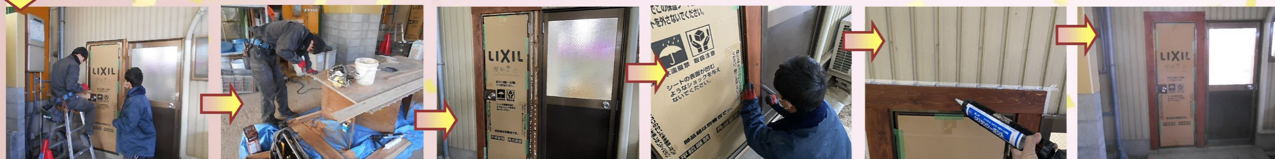
既存のアルミドアを取り替えたことに伴い鋼板外壁の一部を撤去したことで、新しくしたアルミドア幅が以前のドアより狭くなり、鋼板見切りでは隠れなかったので木板を塗装して取り付けました。