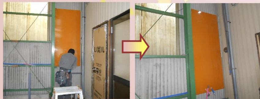
新たに給湯器を設置するので、給湯器用の下地を取り付けます。