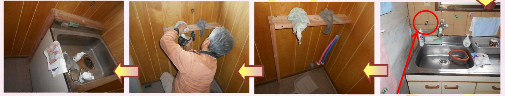
2階の手洗い場に給湯管と給水管を新設し、シンクを戻します。