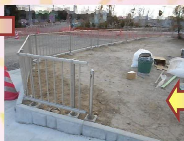
フェンス部材が運び込まれ職人さんが手際よく設置していきます。