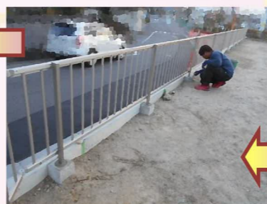
フェンス支柱をセメントで固定します。