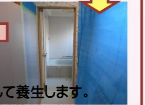
壁には緩衝材とブルーシートを使用して養生します。