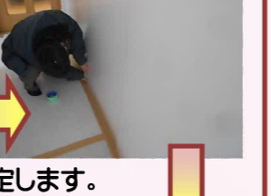
床に養生紙を敷いて、その上に緩衝材、更にその上に養生板を敷いて養生テープでしっかり固定します。