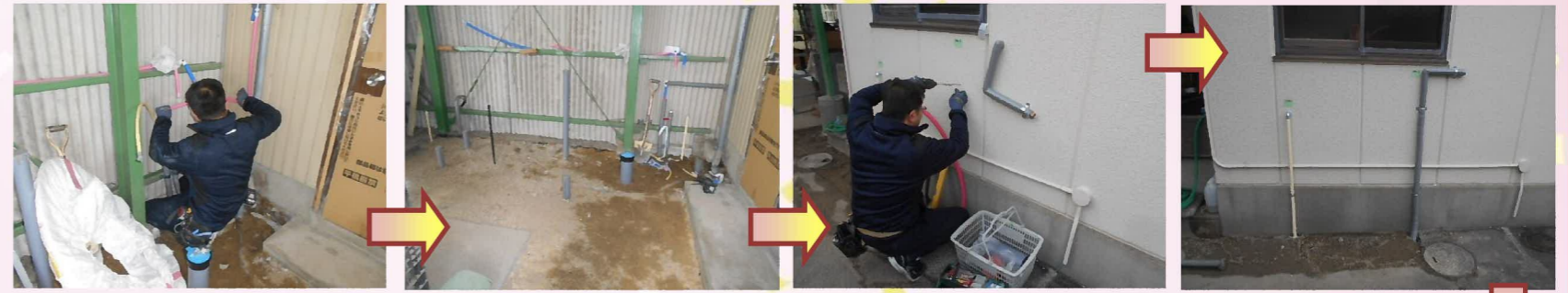
給湯管と給水管の配管を行います。