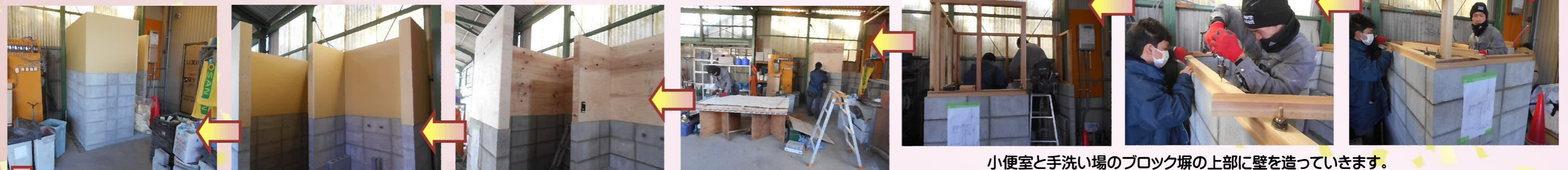
構造用合板で補強して、その上に「プラスタ-ボ-ト」を貼って、壁下地を仕上げました。壁の塗装は施主様の方で施工していただきます。