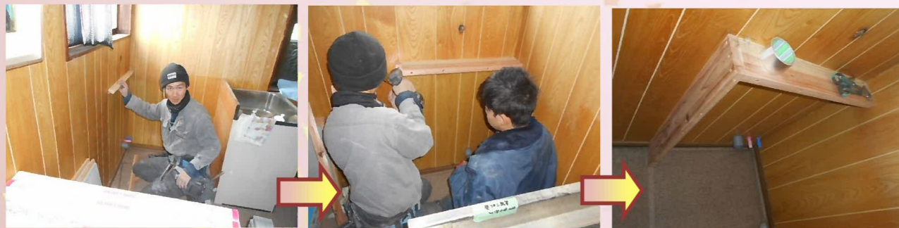
混合水栓へ取り替える為、木桟を取り付けて配管スペースを確保します。