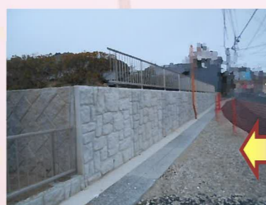
フェンス設置完了です！