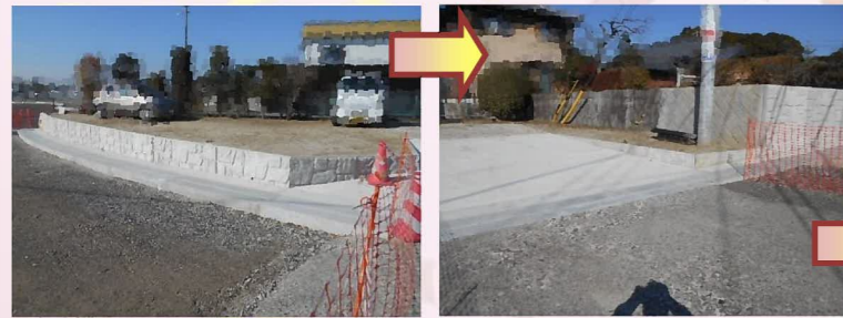
新しくできた擁壁にフェンスを取り付けます。