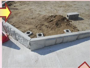
新しくできた擁壁はフェンス等を設置する為の穴がない擁壁だったので、擁壁横に穴を掘って坪基礎を設置しました。