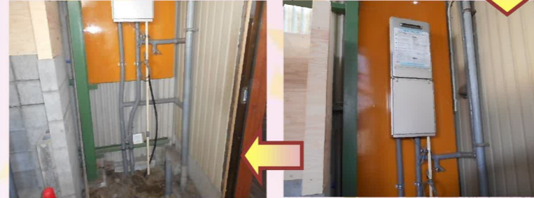
給湯器は通常より高め位置に取り付け、給湯器下に洗濯機等が置けるようにしました。