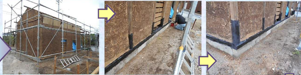
土壁と骨組みだけになった肥料小屋の土台部分に防腐剤を塗布していきます。