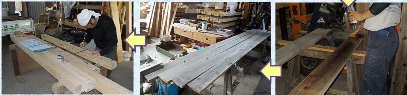
柱材に墨付けを していきます。