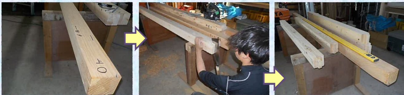
何かの暗号のようなものが… 職人さんはこれをみて材木を刻んでいくんですね…すごい！