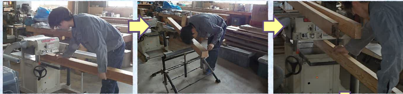
材木の寸法を確認しながら機械の微調整を行いながら加工していきます。