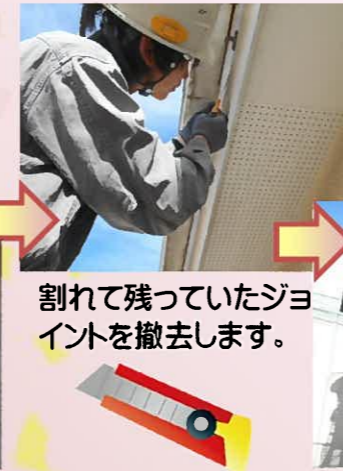
割れて残っていたジョイントを撤去します。