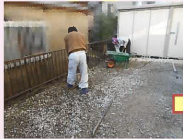
支柱を立てる為の穴を掘っていきます。