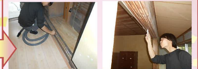
既存の敷居にロウを塗って建具の滑りを良くします。