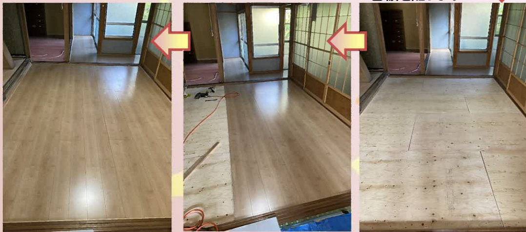
仕上げのフロア材を貼り、居間の床修繕工事完了です。