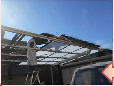
ポリカーボネートを1枚ずつ貼っていきます。