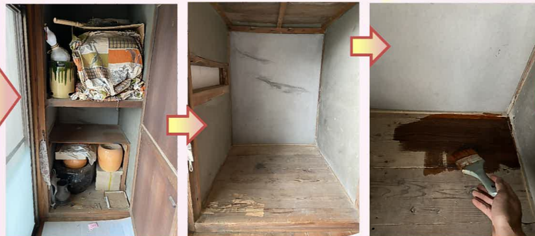
縁側押入の床を増し貼りで修繕します。