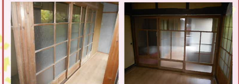
既存の内装建具を戻して全ての工事が完了しました(^_^)v