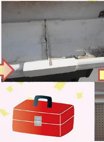
これで雨が降っても雨水が漏れることもなく安心です(^^)