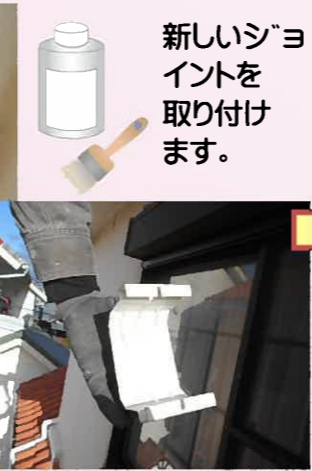
新しいジョイントを取り付けます。