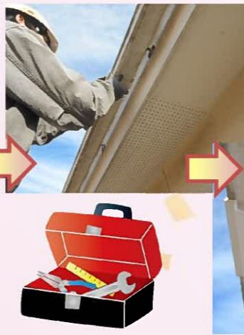
ぴったり納まりました！