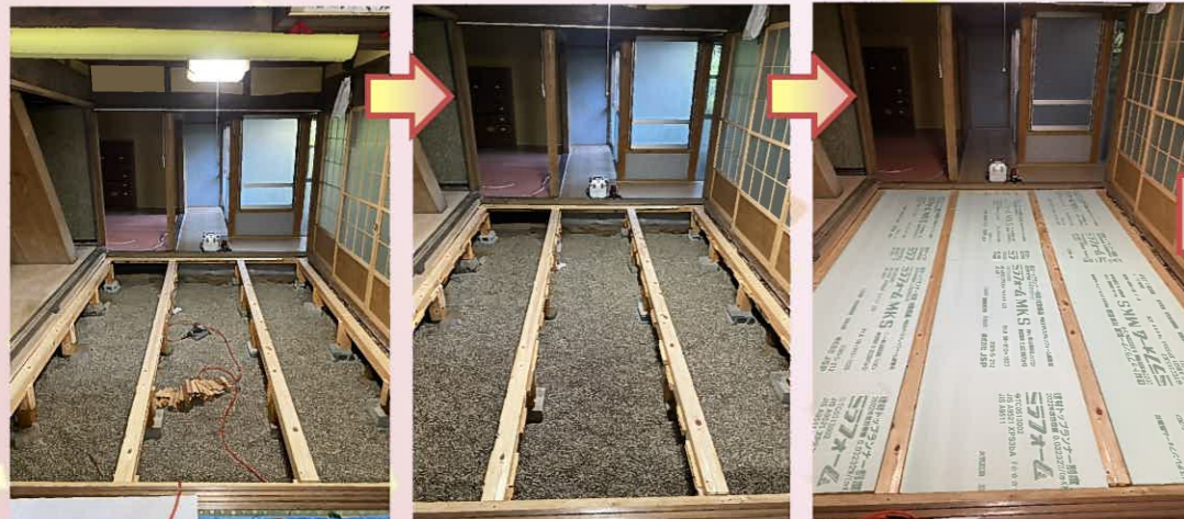
大引に断熱受けを取り付けます。