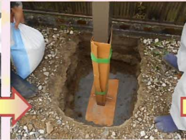
支柱を立て、土のうでしっかり仮固定します。