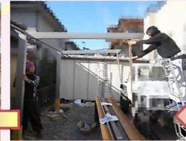
屋根部分を組み上げていきます。