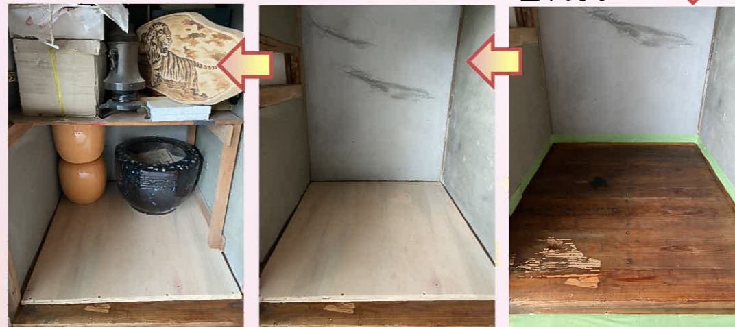
防腐防蟻剤が乾いたらラワンベニヤを貼って、仕切り棚を戻して工事完了です(^o^)/