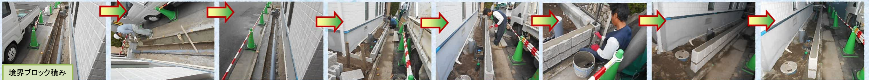
境界ブロック積み