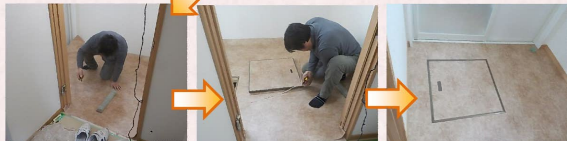
洗面脱衣所の床にはクッションフロアを貼って仕上げます。床下点検口のフタ部分もクッションフロアを貼って仕上げます。