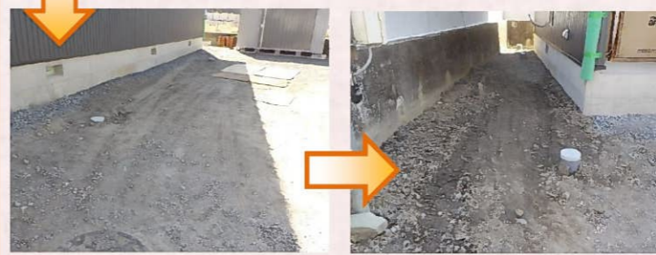
管の設置が終わったら埋戻して埋設管工事の完了です(^o^)/