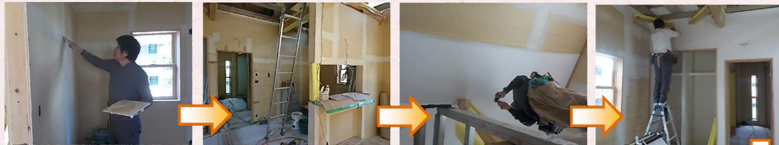
クロスを貼る天井や壁にパテ処理を行い、パテが乾いてからクロス紙を貼っていきます。