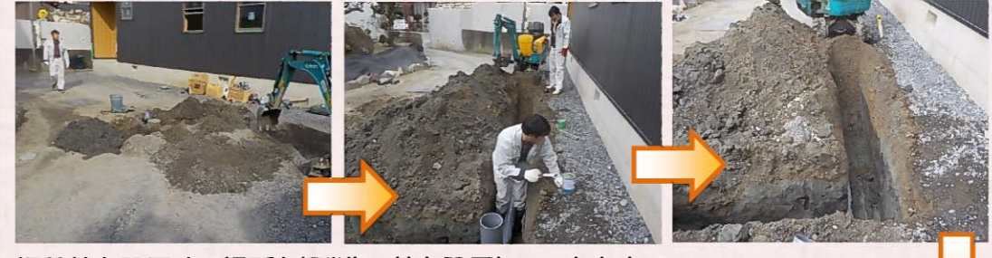
埋設管を設置する場所を掘削し、管を設置していきます。