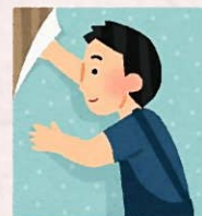
クロス紙が貼られ、グッと部屋らしくなってきました(^o^)