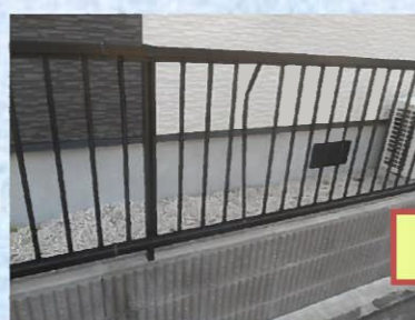
何カ所かの縦格子が曲がったり、キズが入っている状態でした(>_<)被害のあったフェンスを全て取り替えます。