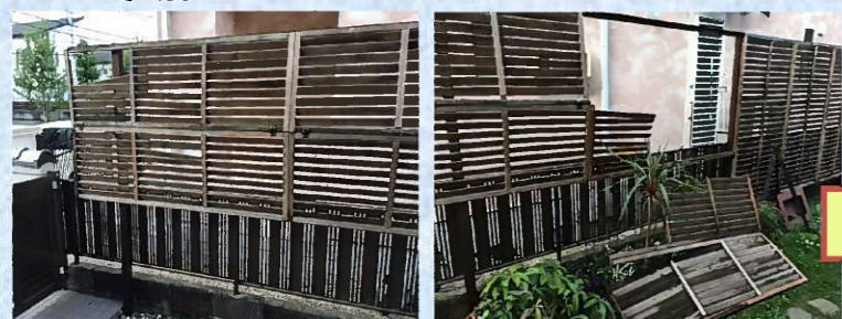
既設の木製フェンスが破損滑落してしまいました(>_<)