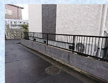
支柱への被害がなかったため、縦格子フェンスのみ取り替えました。年末ギリギリでの取り替え工事となってしまいましたが、キレイになった状態で新年を迎えていただく事ができて良かったです(^^)