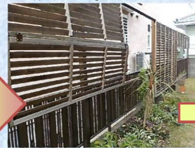
既設の木製フェンスを撤去し、アルミフェンスを組み上げていきます。