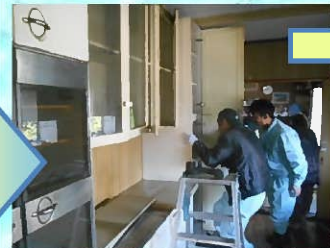
流し台以外の既存の設備は使用するので、破損しないように慎重に取り外していきます。