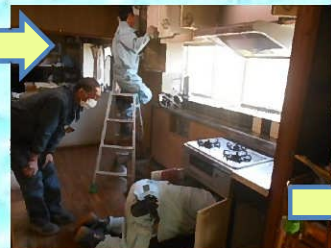
工事中、流し台が使えるように隣の部屋へ移設しました。