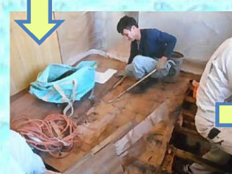
床板を剥がしていきます。