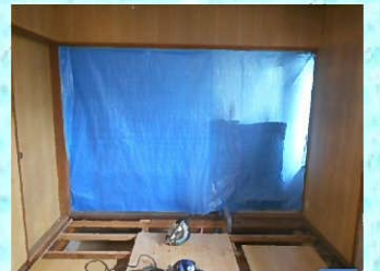
養生をしっかり行ってから工事にかかります