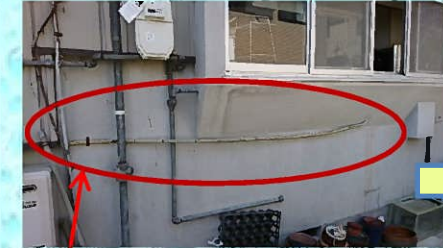
壁からの給水給湯管を床下からに経路変更します。