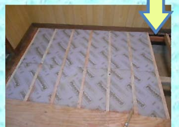
断熱材を充填します。