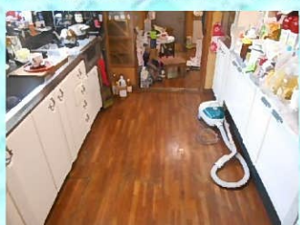
台所の床板を撤去し、張り替えることになりました。