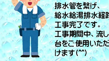
排水管を繋げ、給水給湯排水経路工事完了です。工事期間中、流し台をご使用いただけます(^ ^)