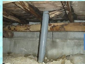
流し台配管の辺りの下地合板が剥離している状態でした(>_<)