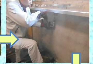
既存の給水給湯管を止める処置を行います。