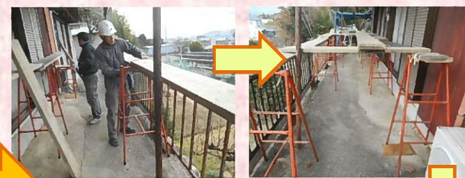
足場を組んでからトタンの解体工事にかかります。