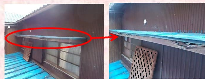
木材部分がボロボロに腐食していました(>_<)