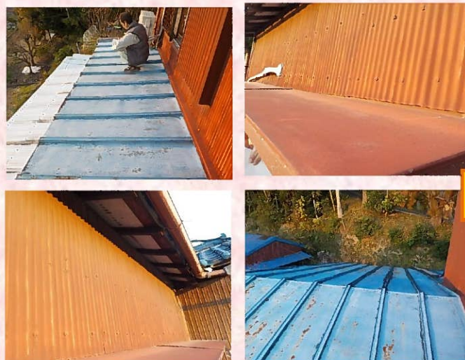
塗装が剥げ、錆が出始めていました。