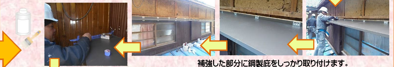
補強した部分に鋼製庇をしっかりと取り付けます。