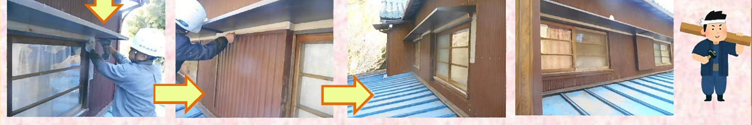
庇の完成です！ 綺麗に仕上がりました(^_^)v