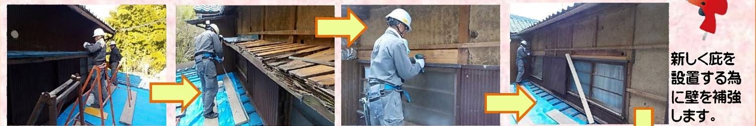
庇の解体工事にかかります。