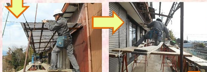
古くなったトタンを一枚ずつ撤去し、骨組みだけにします。 トタンの撤去後、壁の塗装と合わせて鉄骨も塗装し、その後、新たにトタンを張り直します。