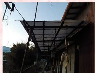
濡れ縁のトタンも傷んだ状態で、めくれあがっていました。