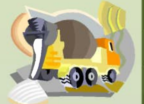
今回は工事車両の出入り口が狭い為、ポンプ車とミキサー車が入らず、 パイプを繋ぎ合わせて生コンの打設を行いました(>_<)