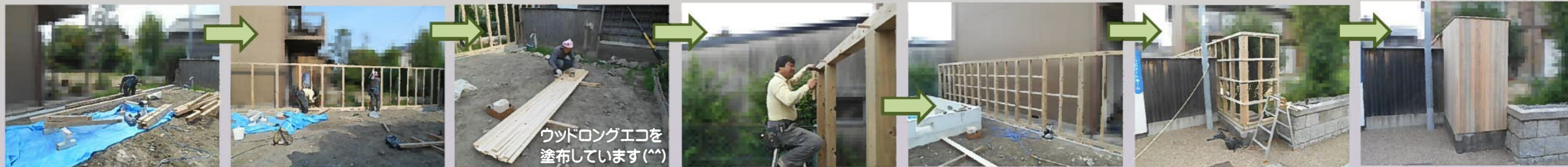
隣地との境に木塀を設置します。材料を運び込んで組み立てていきます。木材には土も水も汚染しない屋外用の木材防護保持剤『ウッドロングエコ』を塗布します。