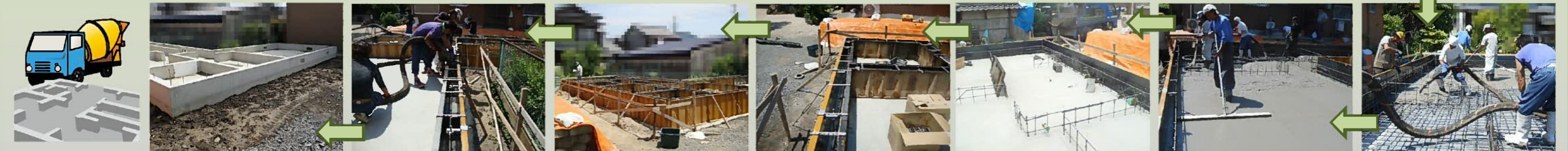
基礎工事完了です！