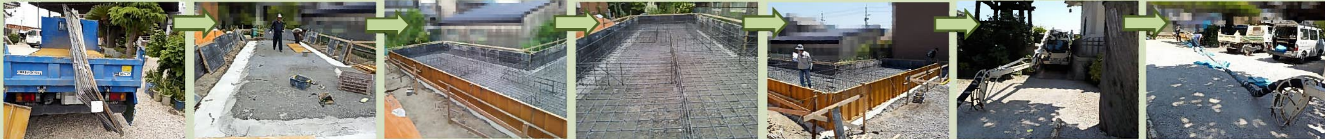
鉄筋が運び込まれ型枠と鉄筋が組まれていきます。