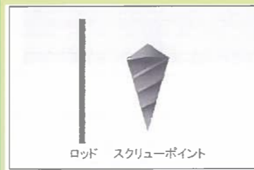
ロッド スクリューポイント