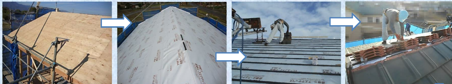
野地板が張られ、防水シートが敷き詰められました。