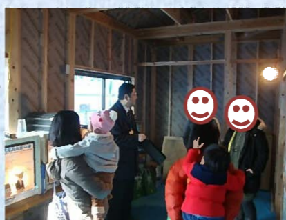
通気断熱WB工法の仕組みを模型を使って解りやすくご説明させていただきました。