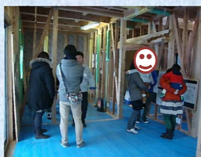
一通りご見学いただいた後は皆さんとご歓談させていただき、楽しい時間を過ごす事が出来ました(^o^)/