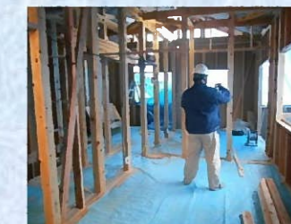
【上部躯体完了検査】

新築・リフォーム・外壁の塗り替え・水廻り改修などをご検討されている方、お気軽にお問い合わせ下さい！