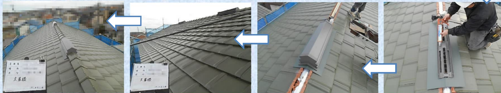
屋根瓦工事が完了しました！