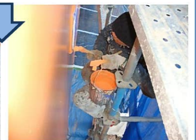
セラミック変性シリコン樹脂2回目塗布 大小さまざまなサイズの刷毛やローラーを使って7細かな部分も塗装していきます。