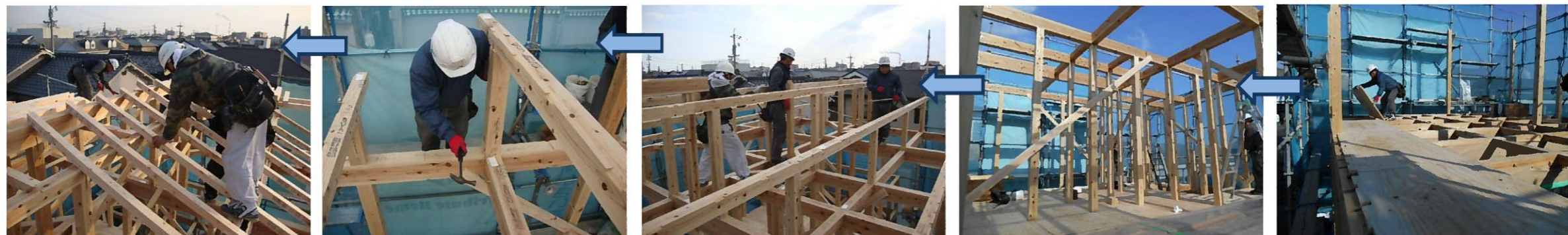
棟部分が組み立てられていきます。高い場所にもかかわらず、大工さん達はヒョイヒョイと移動して作業を行っていきます。高所恐怖症の私には無理です…(>_<)