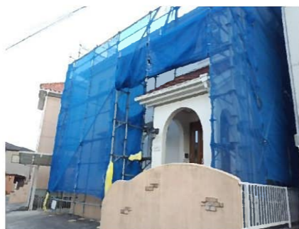
足場設置完了！ 防護ネットですっぽりと覆われました。