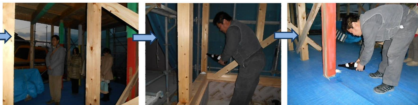
一日の最後には施主様ご家族に建前が無事済んだことをご報告させていただき、建物の四隅と大黒柱にお酒をまいてお清めをさせていただきました(^)