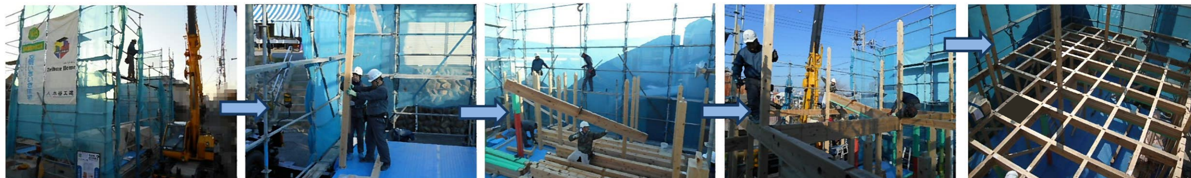
晴天に恵まれ、建前日和でした。