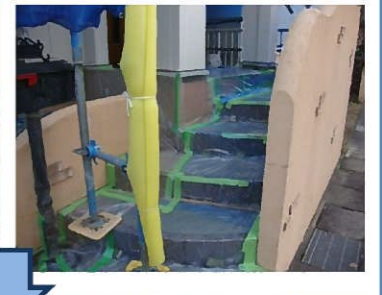
セラミック変性シリコン樹脂1回目塗布