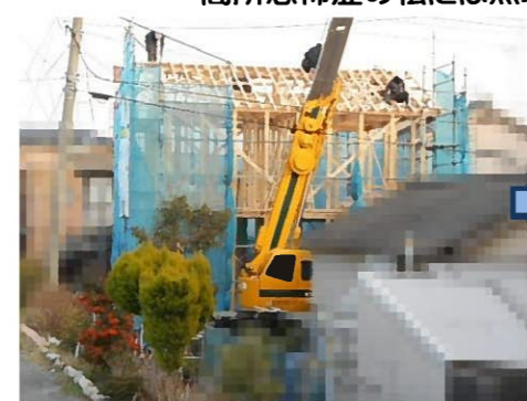
家の形がだんだん出来上がってきました(^o^)