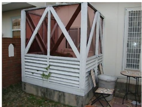
今回の工事で坪庭は撤去しちゃいます。