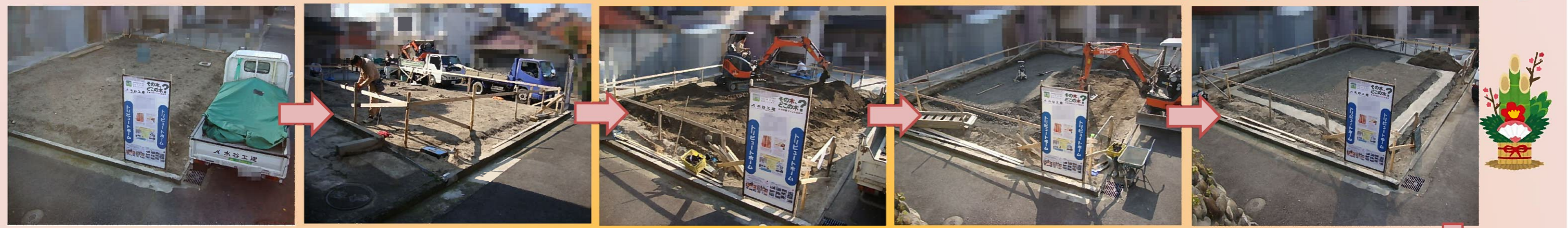
いよいよ基礎工事が始まります！