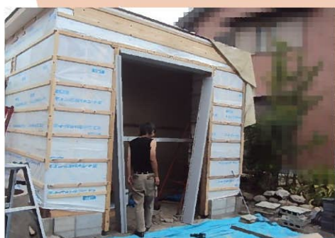
職人さんが手際よくシャッターを 取り付けしていきます(^o^)