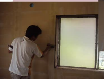
天井からクロス 貼っていきます。