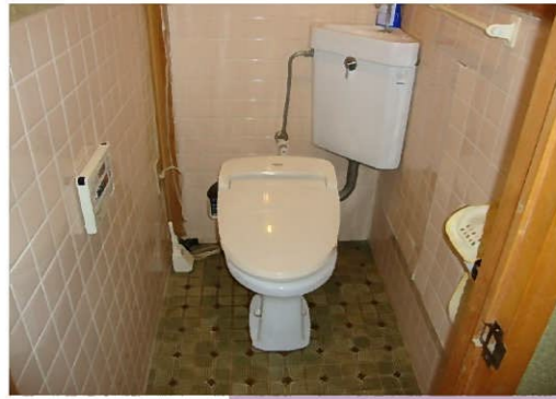
≪ 工事前 ≫

2階トイレの改装工事のご依頼をいただきました。 今回の工事では、衛生設備の入れ換えだけではなく、トイレ部分を増床し、天井と壁の 上部はクロスで仕上げ、壁の下部と床は石貼りで仕上げます。