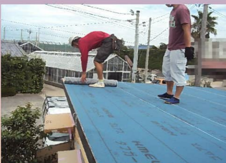
防水シートを貼って…