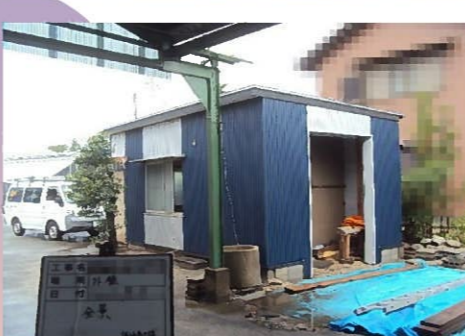
2色のカラーGL鋼板で仕上げました。 おしゃれな小屋になったと思いませんか？ 外観だけを見る限り、小屋とは思えませ んよね～(^_^)