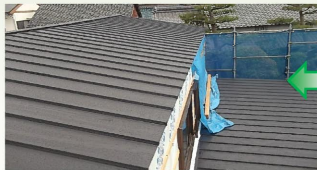
屋根が完成しました！ これで雨漏りの心配もなくなります(^o^)