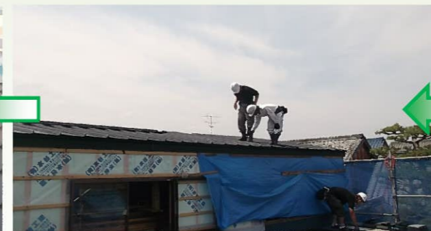
今回の屋根材には「ガルバリウム鋼板」を使用します