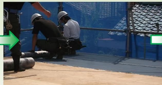
屋根下地に防水シートをキッチリ敷設します。