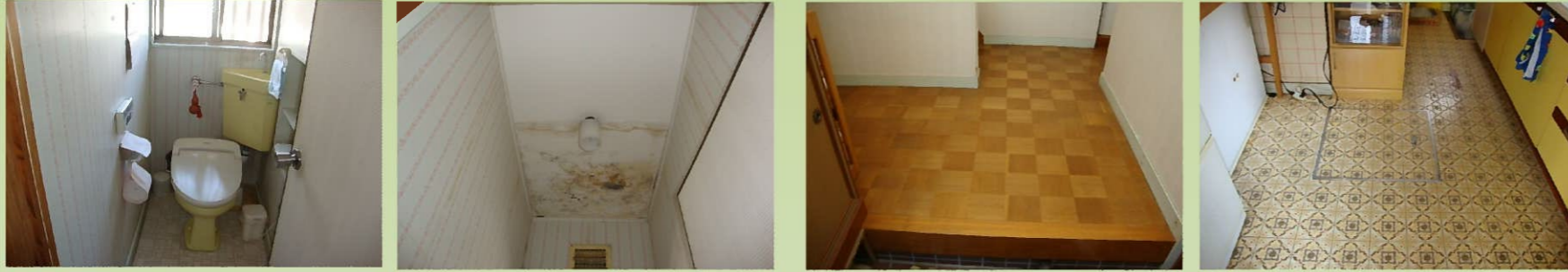
1階トイレの天井は2階トイレの水漏れによりシミになっていました。

《 工事前 》 綺麗な住まいですが経年劣化によりあちこちに不具合がでてきていました(>_<)