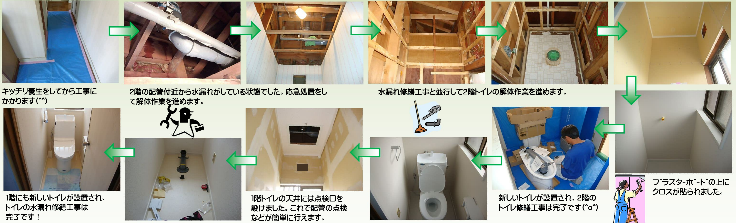
キッチリ養生してから工事にかかります(^)