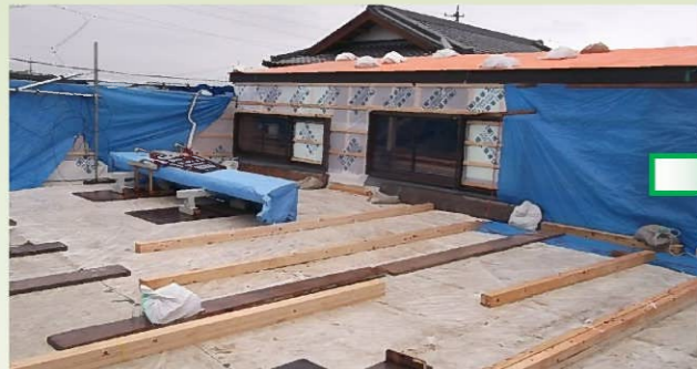
屋根の下地工事が終わり、次の工程へ進みます。