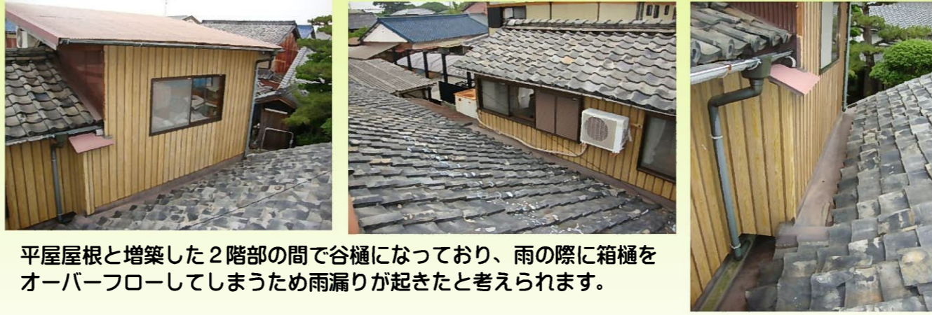
平屋屋根と増築した2階部の間で谷樋になっており、雨の際に箱樋をオーバーフローしてしまうため雨漏りが起きたと考えられます。