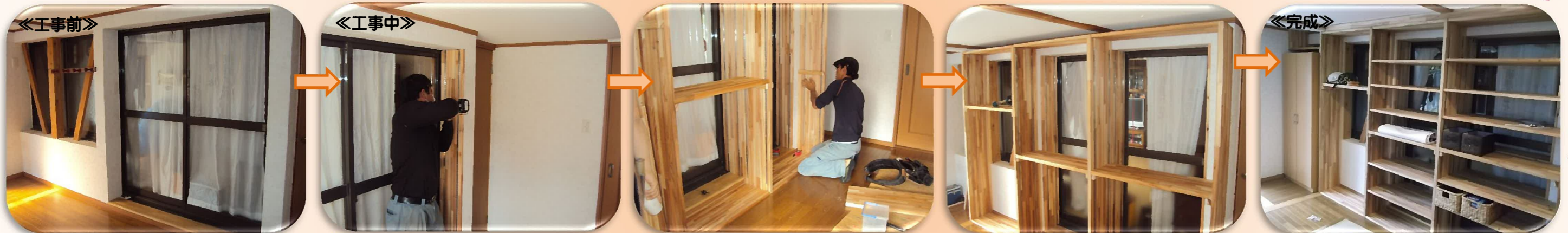
《工事前》 このスペース部分に収納棚と靴箱を設置します。