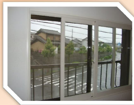
内窓を設置した窓

今回の取り替え工事のように窓ごと取り替える方法の他に内窓を設置する方法もあります。 冷暖房費を節約する他にも内窓を設置することで、外からの騒音も、室内の音漏れも軽減できます。 窓のことでお困りごとがありましたら、お気軽にご相談ください。