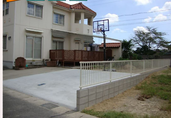
大きなテラスを設置したので、急な雨が降っても洗濯物が濡れる心配がないので安心です！