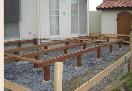
ウリンは非常に硬い木材なので加工するのも大変なんです(>_<)