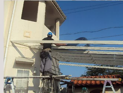
大きなテラスが手際よく組み立てられていきます。