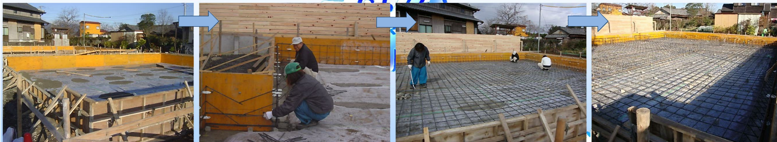
型枠を組み立てて、一本ずつ基礎配筋を組んでいきます。

基礎工事が終了後、弊社では生コンが十分に硬化するように2～3週間ほど養生期間となりますので、年内の工事はここまでになります。養生期間の間に年明け早々に予定している建前準備などの刻み加工を進めます。