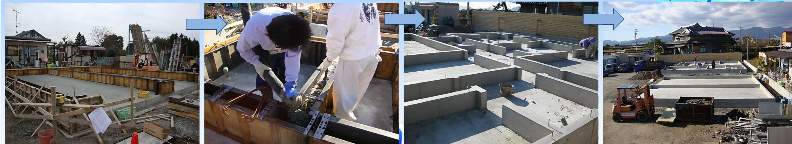
基礎立上りの型枠を組んで生コンを流し込みます。