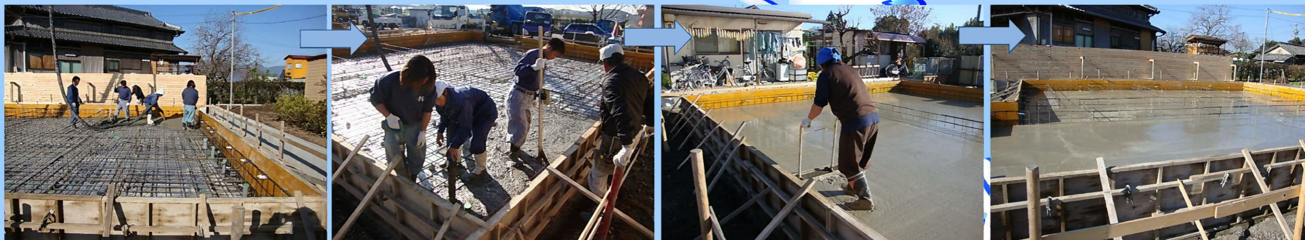
基礎配筋の上に生コンを流し込んでいきます。