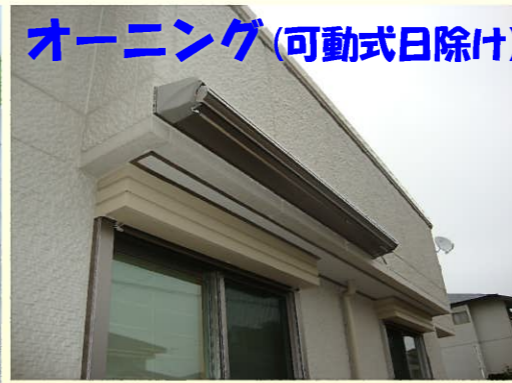
オーニング(可動式日除け)