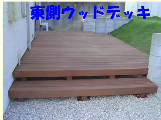
東側ウッドデッキ