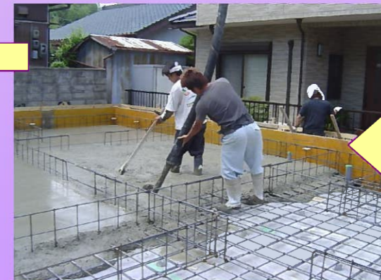
基礎配筋の上に生コンを流 しこんでいきます