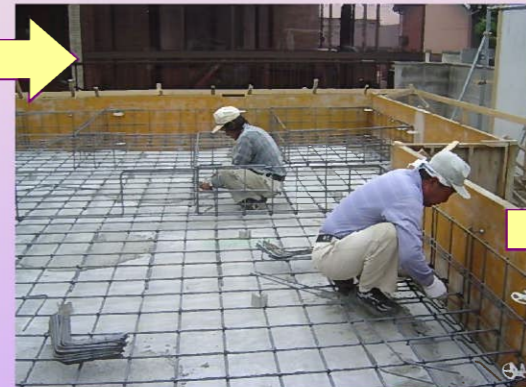
基礎配筋を組んでいきます