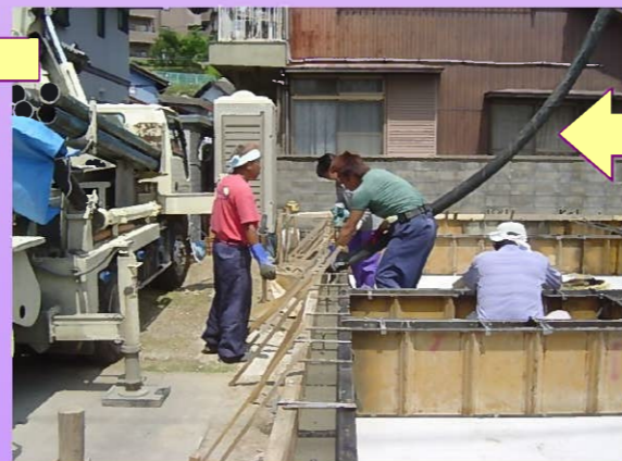
型枠にそって生コンを流し こんでいきます