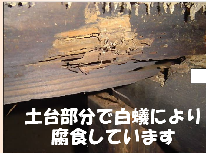
土台部分で白蟻により 腐食しています