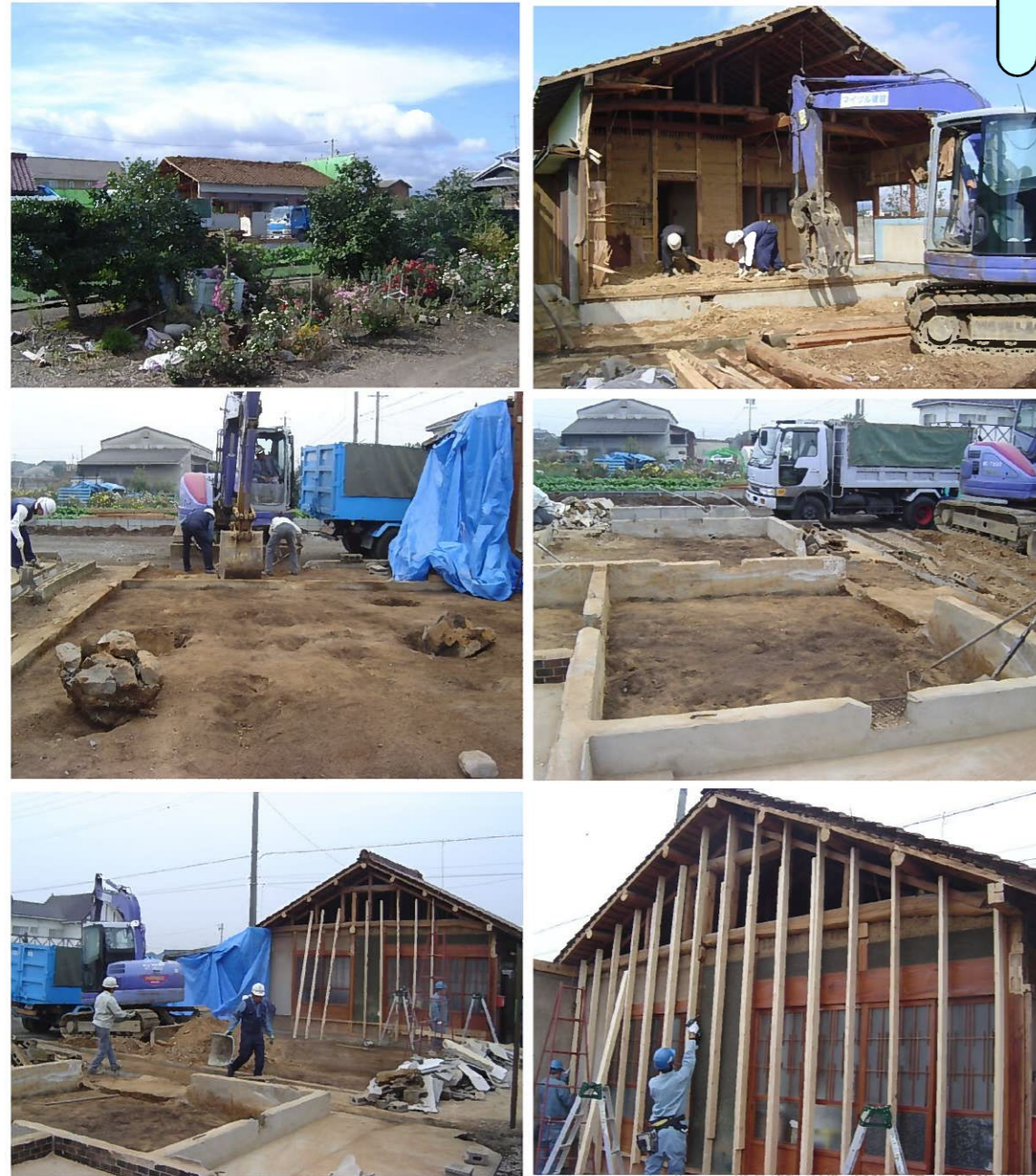
下大久保 トリビュートホーム 新築現場

この現場は地盤がしっかりしていたので 改良工事ナシで良かったんだ 地固め・ベタ基礎工法でOKだったよ！ 地盤・基礎配筋とも第三者検査機関の JIOから合格を頂きました