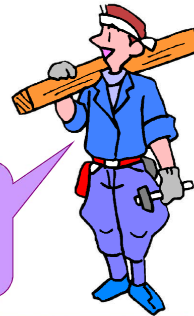
第三者機関による検査