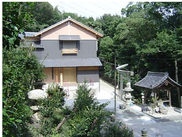
朝日町 神社社務所 新築工事