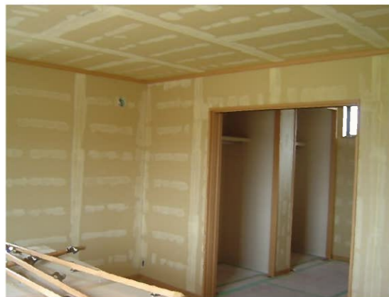
日永東 トリビュートホーム 新築工事