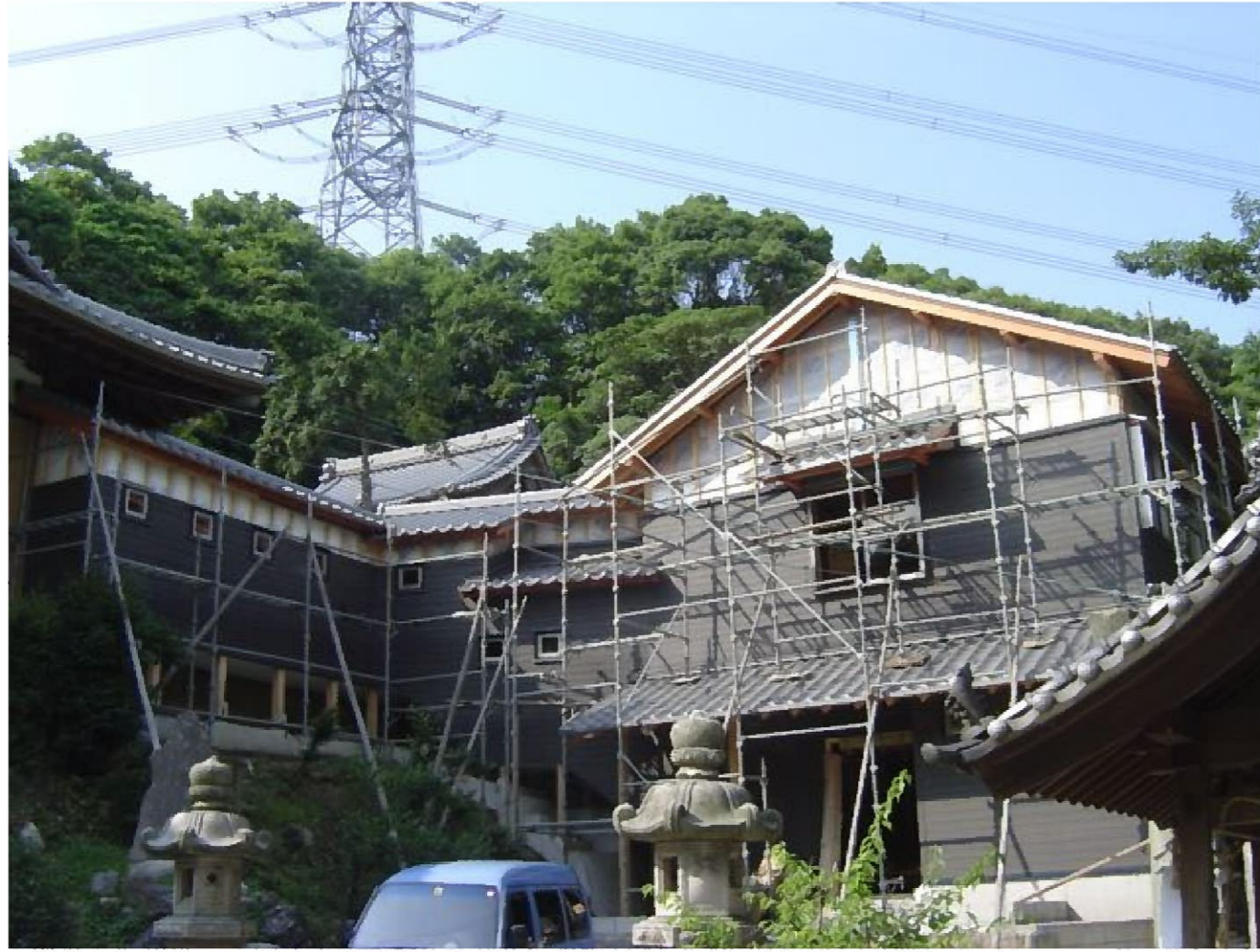
朝日町 神社社務所 新築工事

夏号1ページ目は 完成間近い2棟から 紹介します。 社務所はかなり 大きいのでまだ 2ヶ月位はかかるで しょうけど、現在は こんな感じです。