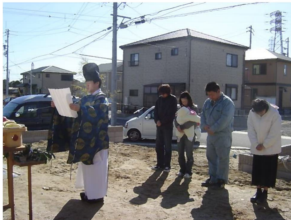
施主様と私と弊社設計士です さすがに神妙・・・