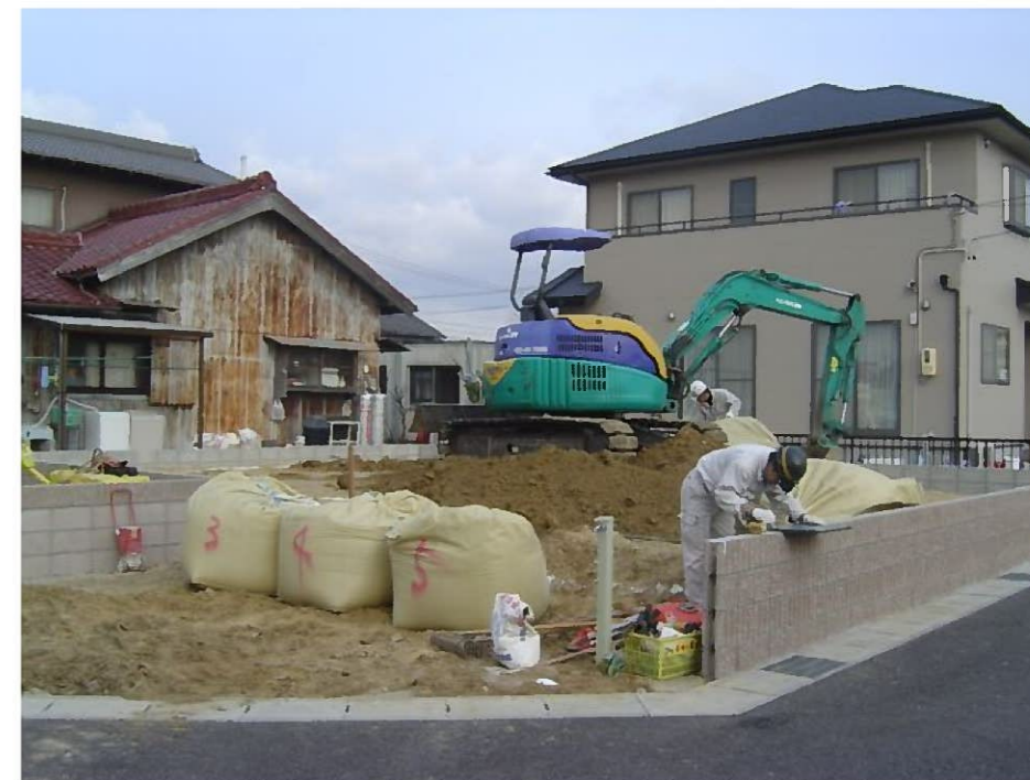
今回は客土が緩いので表層改良です