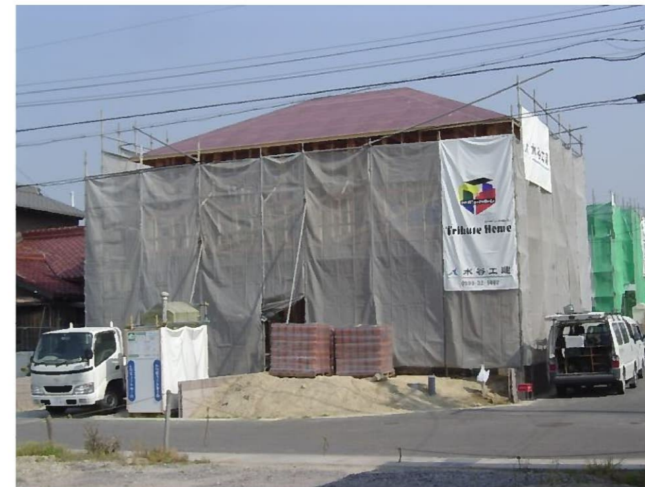
今は外から見るとこんな感じです