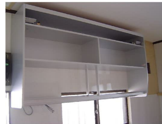
窓の前に取付けても大丈夫！優れものなのだ！