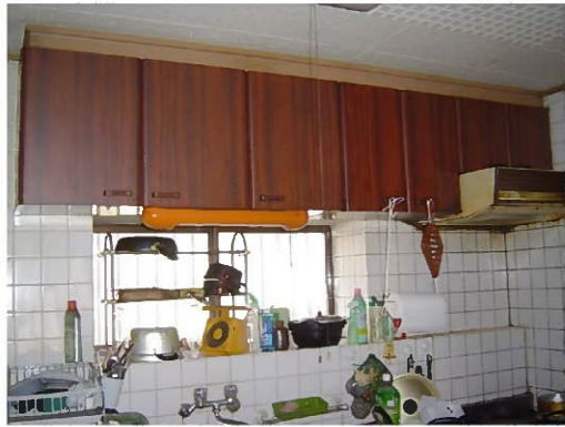
↑ 改装前 ↑