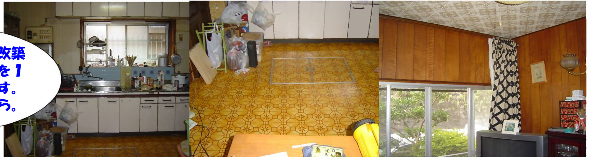
津市野田 改築現場

今回は津市野田の改築現場と倉庫、小屋を1物件ずつ紹介します。まずは改築現場から。