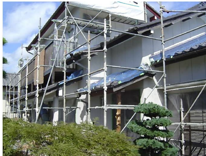
外壁コーキングも良く乾いたな さあーいよいよ塗装開始です と、その前に 養生養生！瓦が汚れないようにしなくっちゃね！