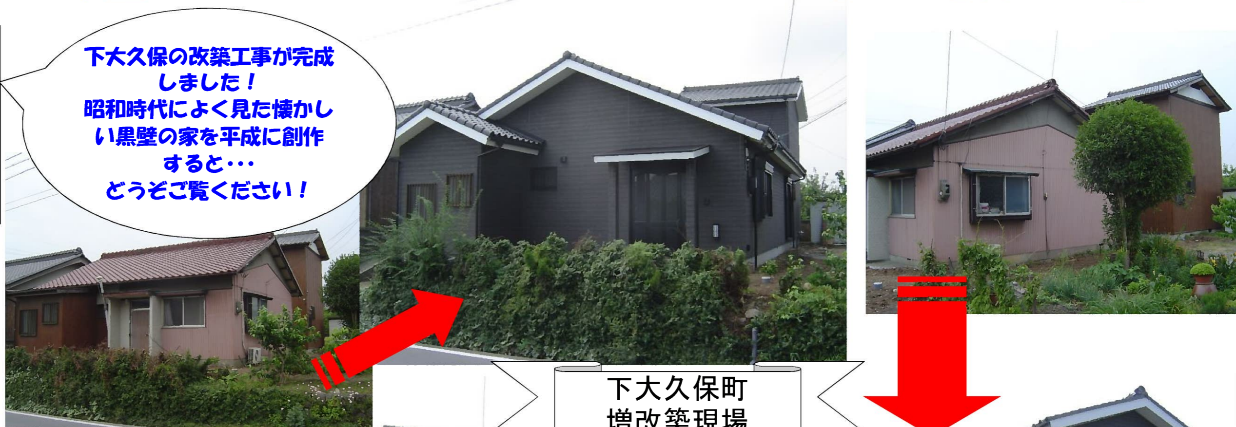
下大久保町 増改築現場

下大久保の改築工事が完成 しました！ 昭和時代によく見た懐かし い黒壁の家を平成に創作 すると… どうぞご覧ください！