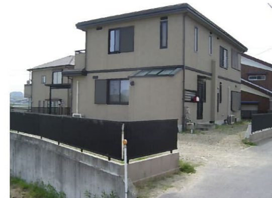
実はこの建物、大手プレハブメーカーなんです プレハブ住宅に増築するのは大変なんです！