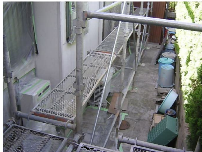
はいはい！地面もキチンと養生ね！ これって意外としない会社が多いんですよ 土の上はともかく、コンクリートの上は養生が必要です