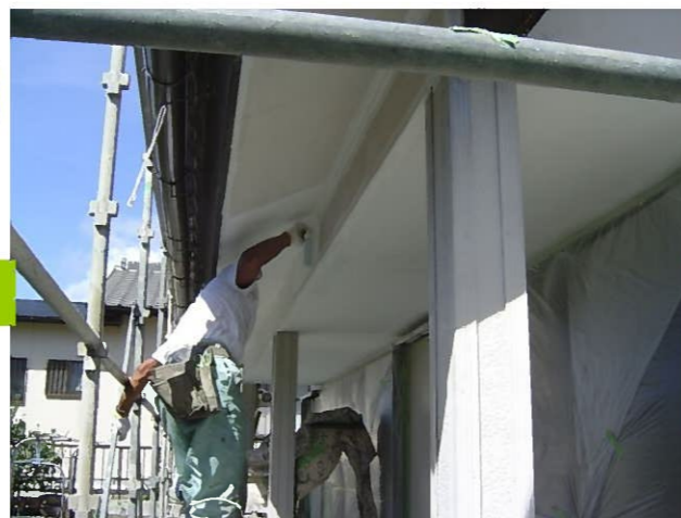
よーし！塗装工事開始です！ 弊社では最高級塗料の変性シリコン系を使用します 耐候性、耐久性、すべてに最高です！

今月は9月に完成した物件の中から 下大久保の物件以外に2件紹介します。 全部紹介できなくてごめんなさい。 1件目は7月号で少し紹介した曾井町の 外構・倉庫建築工事です。 もう1件は笹川町の外壁塗替え工事を 紹介します。 リフォーム、増改築をお考えの方は 是非、お問い合わせください！