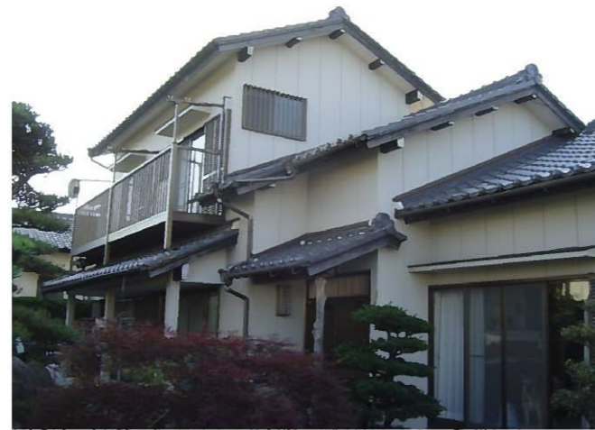
まずは現地調査をして、お客様と何回も打合せをします この現場では外壁コーキングの取替も必要なのが調査で 判明しました 現地調査は大事ですよ！