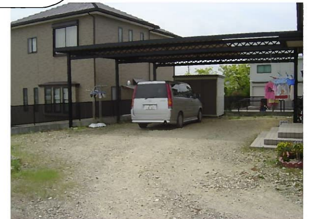
雨の日にはぐちゃぐちゃで困って見えました 夏は雑草が大変さに輪をかけていたそうです