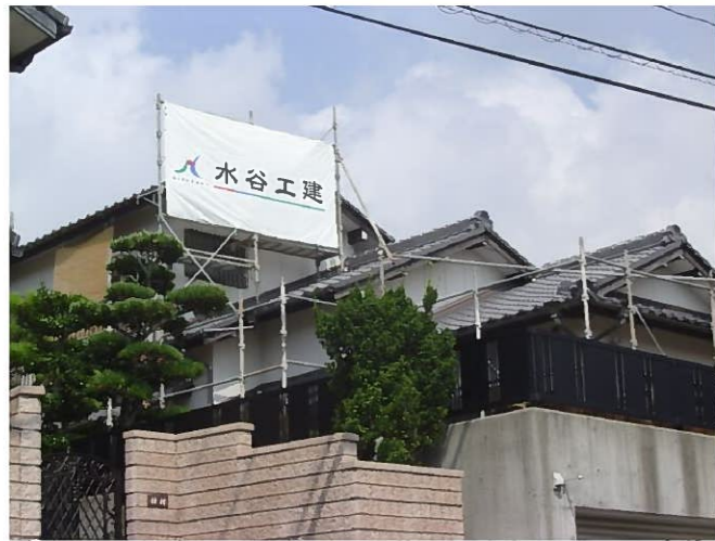
工事着工！仮設足場をかけます この現場は隣家との境にスペースが確保できましたので 防犯の為にあえてネットは張りませんでした