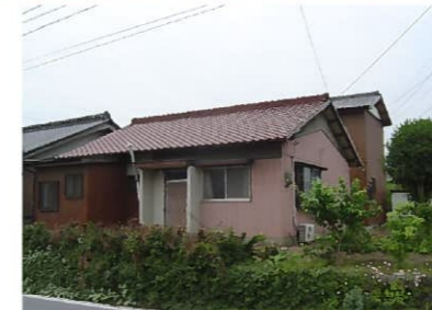
下大久保町 増改築工事