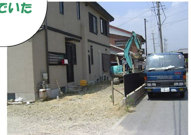
曾井町外構・ 倉庫建築工事