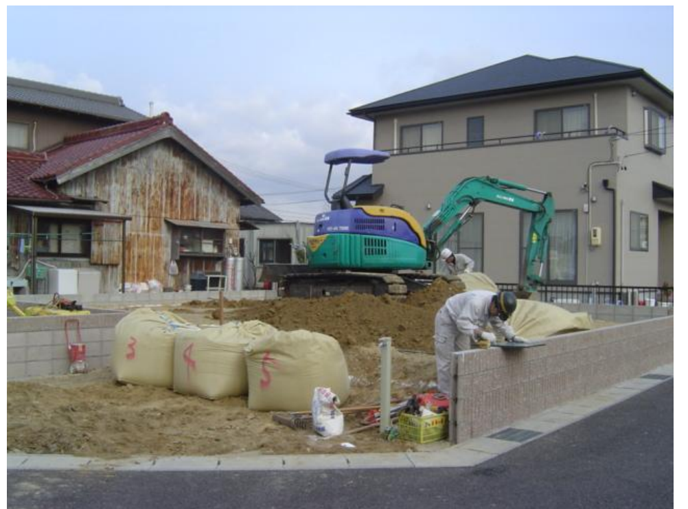
今回は客土が緩いので表層改良です