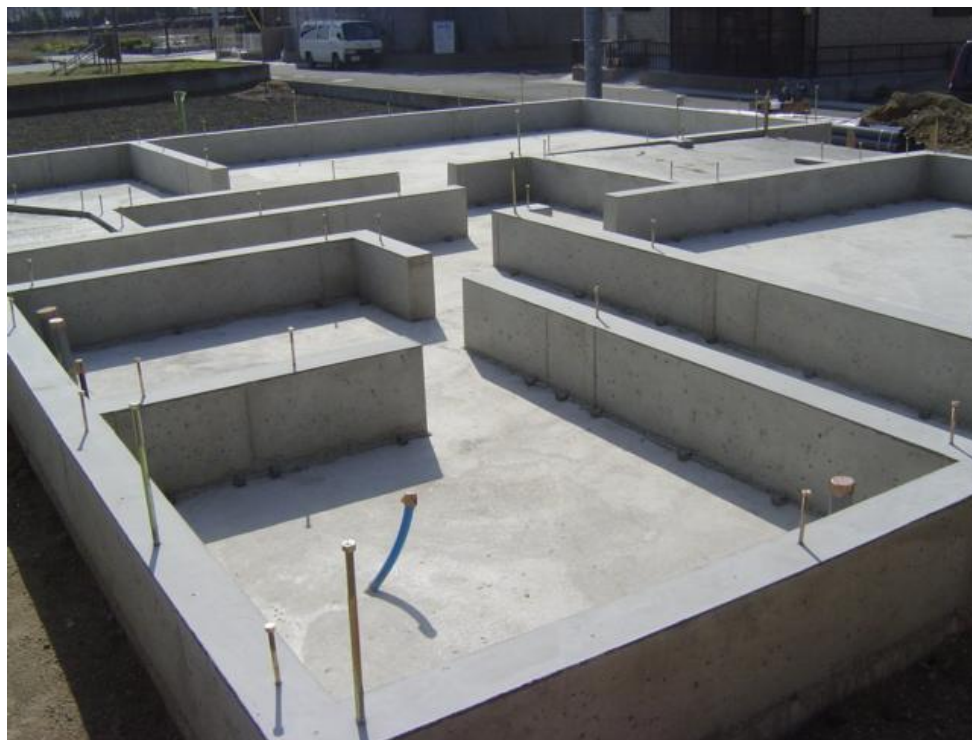
頑丈な基礎の出来上がり！！