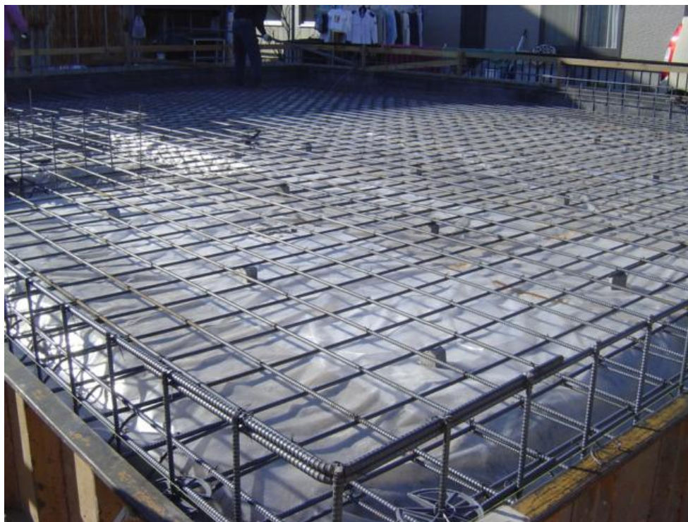
きれいな配列の鉄筋でしょ！(^o^)