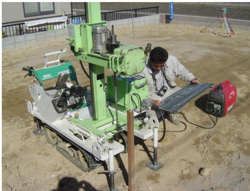
地盤調査を行い、地盤改良・基礎を考えます