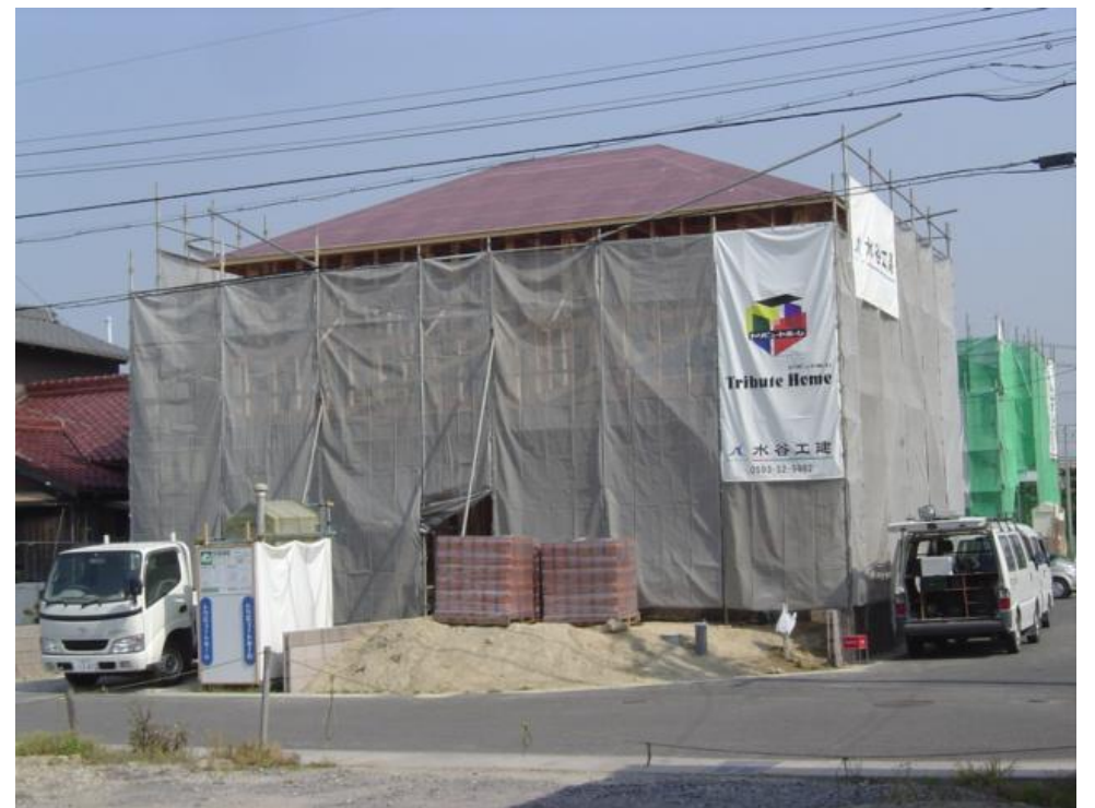
今は外から見るとこんな感じです