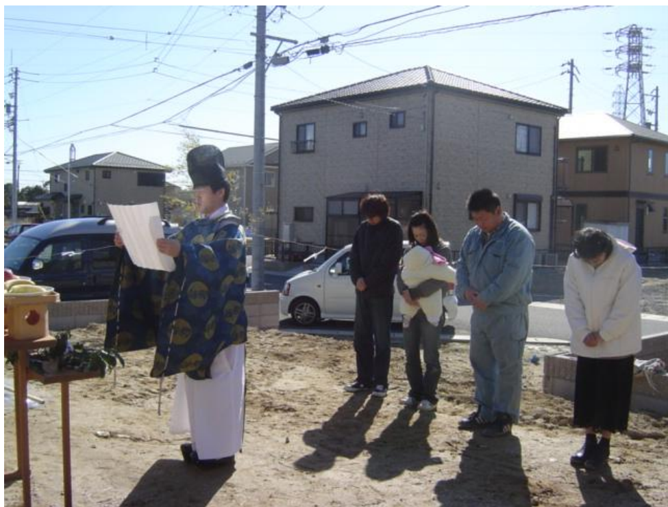
施主様と私と弊社設計士です さすがに神妙・・・