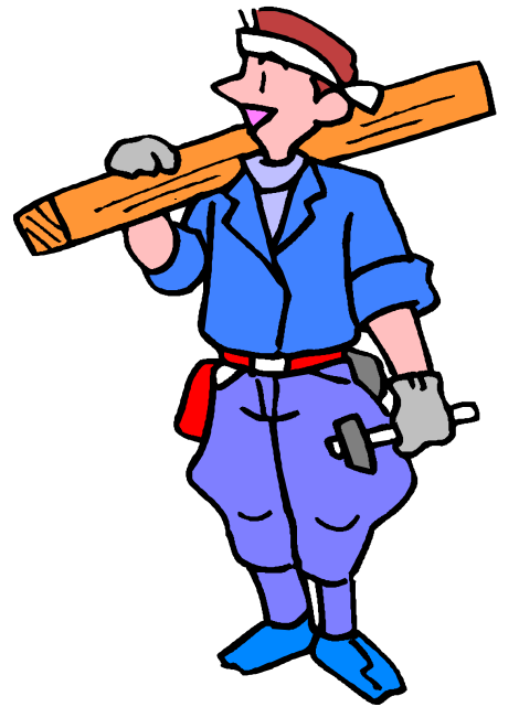
朝日町 神社社務所 新築工事