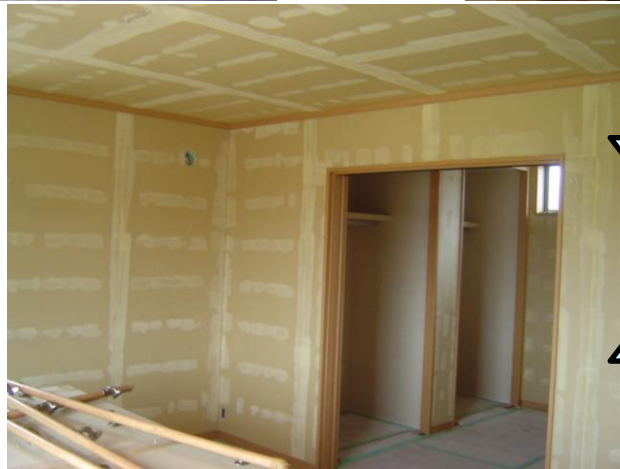
日永東 トリビュートホーム 新築工事