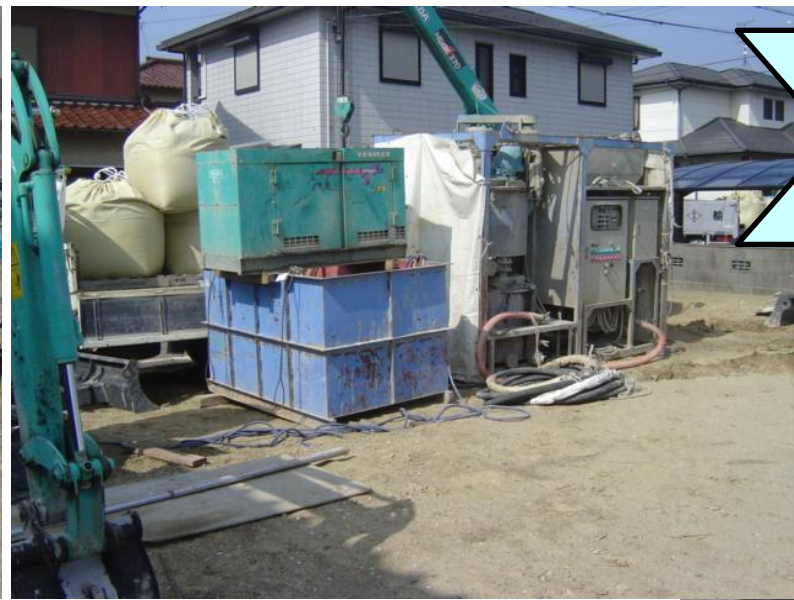
北堀江町 トリビュートホーム 新築工事