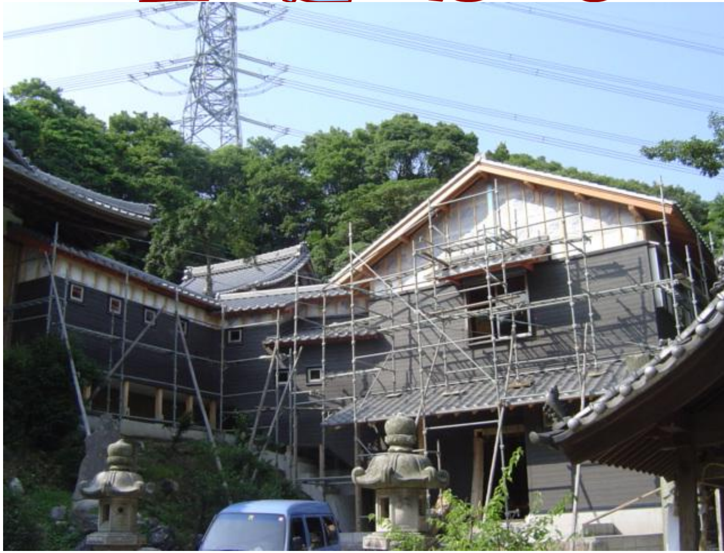
朝日町 神社社務所 新築工事

夏号1ページ目は完成間近い2棟から紹介します。社務所はかなり大きいのでまだ2ヶ月位はかかるでしょうけど、現在はこんな感じです。 日永東の物件も大工工事が完了仕上げ工事にかかり