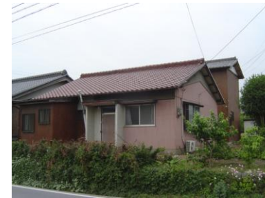
下大久保町増改築